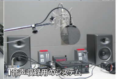
「音声収録用のシステム」