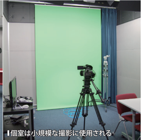
「個室は小規模な撮影に使用される」