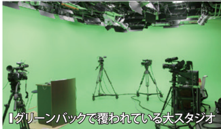
「グリーンバックで覆われている大スタジオ」