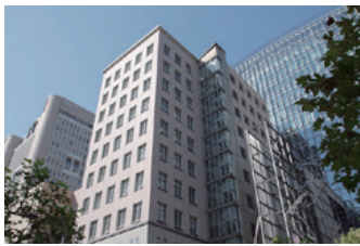
明治大学駿河台キャンパス