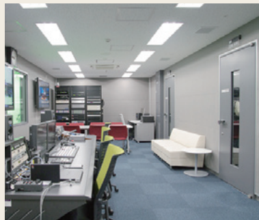
編集室の右側には個室も見える