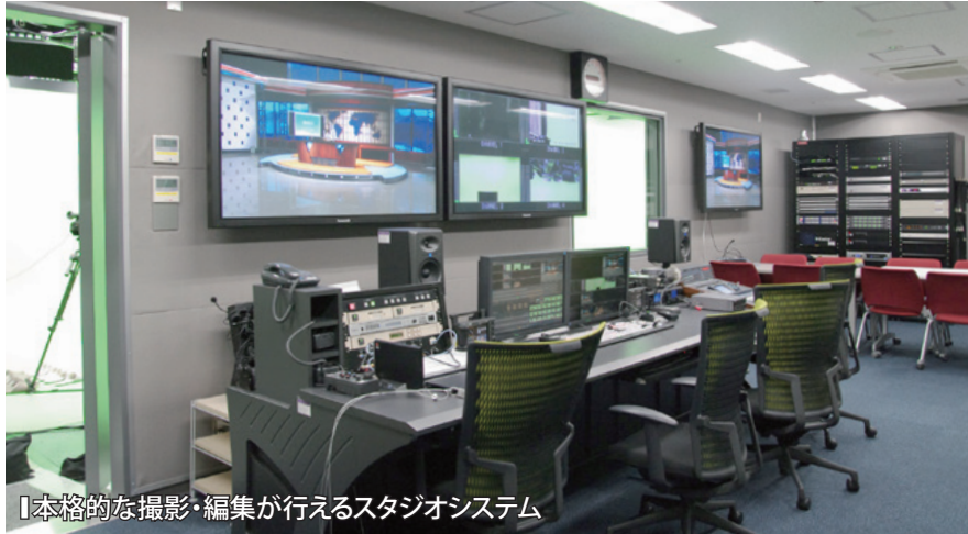
「本格的な撮影・編集が行えるスタジオシステム」