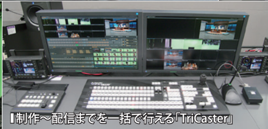
「制作～配信までを一括で行える「TriCaster」」