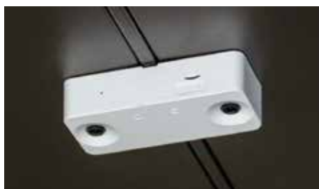
入退場者を認識する双眼カメラ