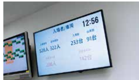
入退場者と入出庫の数値を表示する43インチモニター