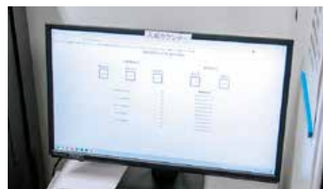
カメラで認識した入退場者と入出庫をカウントするシステム