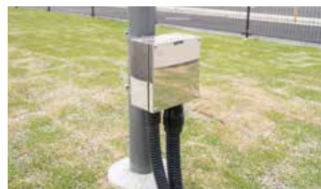
入出庫識別カメラの根元にある避雷器とメディアコンバーターを入れた収納ケース

遠山様は最後に「おかげさまで、全国の場外馬券場から問い合わせや見学があります。これを機に、全国的に販売して欲しい」と語ってくださいました。