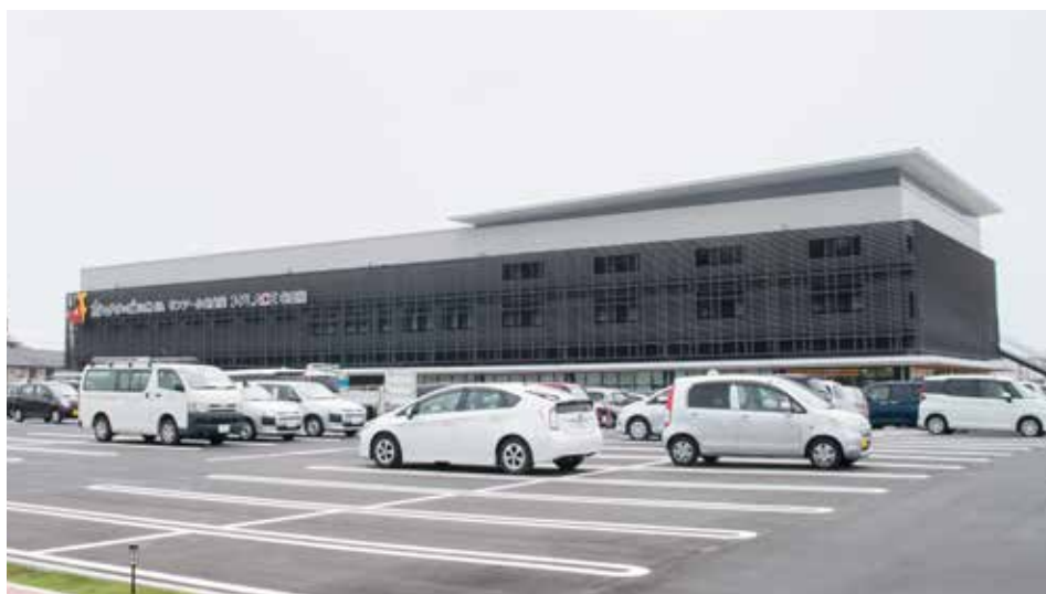
2024年2月にオープンした新場外馬券場(新サンアール名古屋)

愛知県競馬組合様は、名古屋競馬場を2022年4月に名古屋市から弥富市に移設。2年後、その跡地に新しい場外馬券場を開業しました。バーチャル競馬場システムを備えるなど新しい試みに挑戦するこの施設に入退場者と入出庫をカウントするシステムを導入させていただきました。