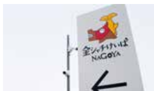
「金シャチけいばNAGOYA」は名古屋競馬の愛称