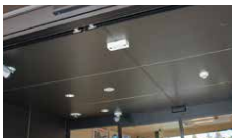
3箇所の出入口の天井に双眼カメラを設置（写真は東口）