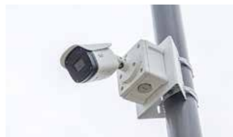
駐車場の出入口に設置されている入出庫識別カメラ