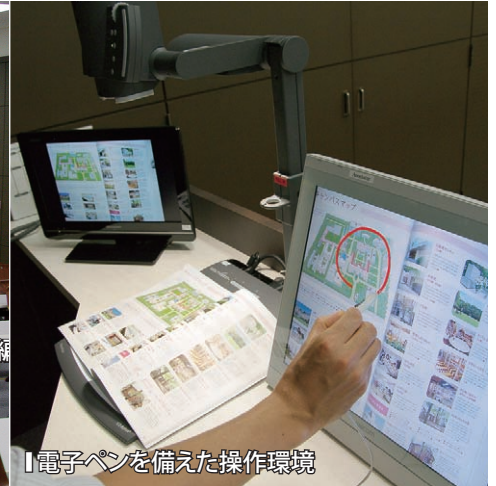
【電子ペンを備えた操作環境】