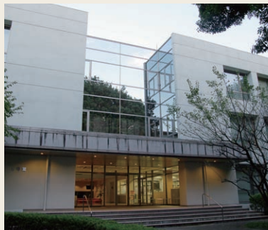
設備を全面リニューアルした視聴覚センター