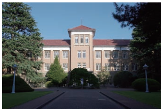
津田塾大学小平キャンパスの本館