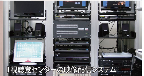
【視聴覚センターの映像配信システム】