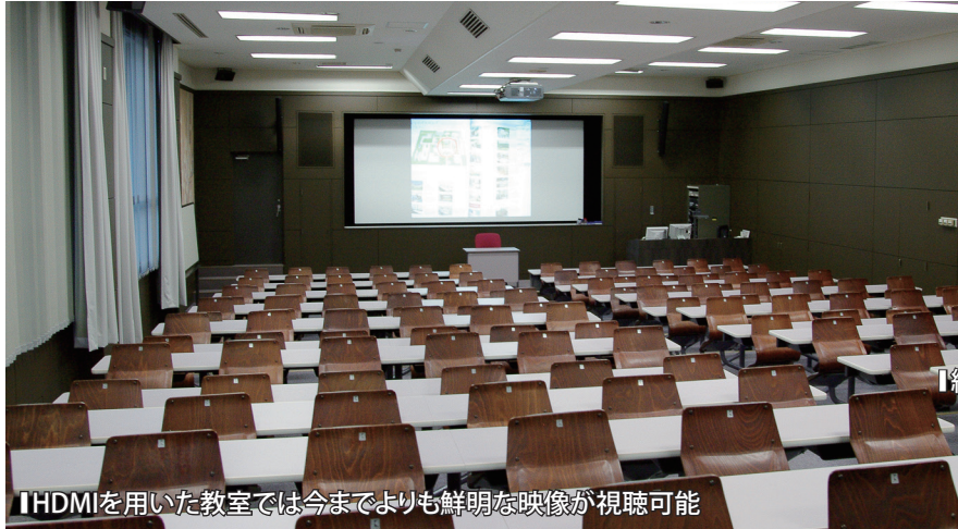
【HDMIを用いた教室では今までよりも鮮明な映像が視聴可能】