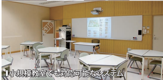
【小規模教室でも対応可能なシステム】